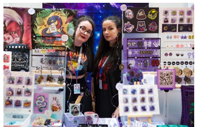
Artistas en Toledo Matsuri 2024